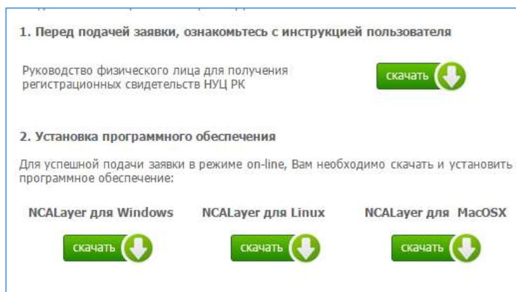
Рисунок 2. Загрузка NCALayer

3.2. Далее в зависимости от Вашей операционной системы скачиваете NCA Layer, нажав на кнопку «Скачать» (Рисунок 2), и устанавливаете у себя на компьютере.