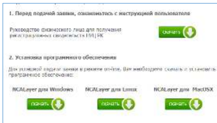
Рисунок 2. Загрузка NCALayer

3.3. При возникновении вопросов касательно установки программного обеспечения NCALayer просим обратиться на Службу поддержки НУЦ РК по номеру 1414 либо по электронной почте support@pki.gov.kz .